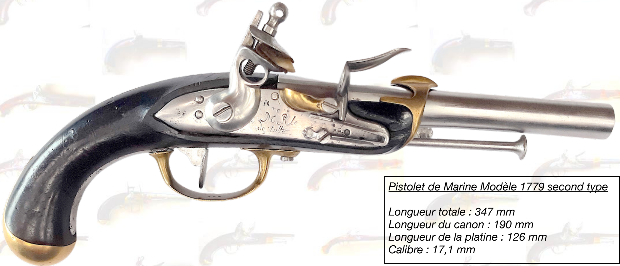
Pistolet de Marine Modèle 1779 second type

Assurément une arme rare qui mérite sa place dans une belle collection de marine.