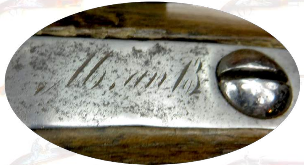
La queue de culasse porte nettement la marque du modèle "M An13" légèrement usée.