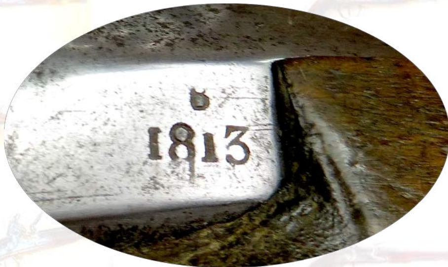
Sur le canon, à gauche la date surmontée du poinçon de D.Bouissavy, contrôleur.